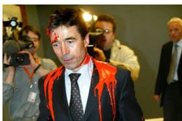
Modige unge mennesker turde gøre modstand mod Rasmussens militarisme

Fogh-Rasmussen meddelelse allerede USA et år før Irak-krigen startede, at Danmark ville deltage i denne krig, og under sit besøg hos George Bush blev han belært om Danmarks pinlige rolle som Hitler-allierede inden og under 2. Verdenskrig, og denne - for Fogh-Rasmussen - nye lærdom gjorde så stort indtryk på ham, at han - da han kom hjem - mente, at Danmark i fremtiden måtte støtte USA endnu mere, for Rasmussen mener at det var USA, som vandt 2. Verdenskrig og at kampen mod Hitler derfor kan sammenlignes med USA's senere kamp mod andre "diktatorer", som man ikke bryder sig om. Her tænkes især på Saddam Hussein og Muhammed Gadaffi, men hvis ressourcerne havde været til stede, ville den senere generalsekretær sikkert også gerne have været i krig mod Rusland.