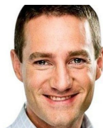
Foto fra Jarlovs valg- brochure

Rusland og det danske militær har altid ligget Jarlov meget på sinde, og han er stolt af sin uddannelse som reserveofficer i det danske forsvar. Jarlov er kendt som en mand, der har fuld tiltro til at det danske forsvar - naturligvis under ledelse af USA - altid vil gøre godt ude i verden, hvor det bidrager til at løse mange problemer. Ddt ser man f.eks. i Afghanistan, Irak og Libyen, hvor Jarlov er tilfreds med den dansk-amerikanske indsats, og ikke mener at de over 1 million ofre er for høj en pris at betale for at skabe kaos og sektersk splittelse i disse lande. I USA og England er man meget skeptisk overfor resultatet af de pågældende interventioner og bombekampagner, men det bekymrer ikke Jarlov. USA er det faste ankerpunkt i hans livssyn, og alt hvad USA beslutter sig for er rigtigt. Altså iflg. Jarlov.